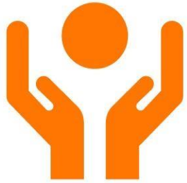
PROTECTION FROM VIOLENCE